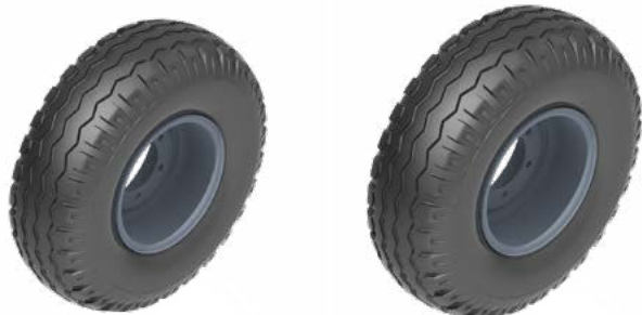
Roue 11.5/80x15.3 TAPIR 80