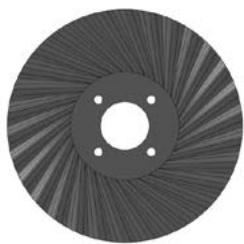
Disque gauffré Ø 410 mm 30 ondulations