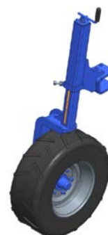
Roue de contrôle