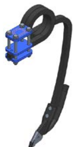
Dent + soc semeur DSB