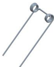
Dent de recouvrement Double