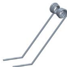
Dent de recouvrement Double et coudée